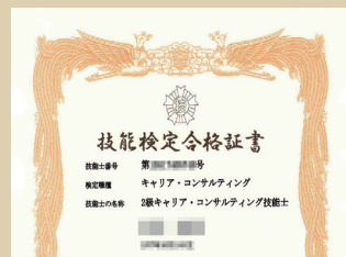
国家資格保持者の講師陣