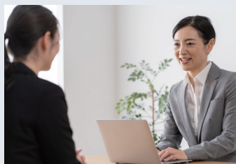
実践的な内容のカリキュラム

キャリアカウンセラーとは何か、これからの自分にどう生かしていくか、仕事にしていけるにはどんなことが必要なのか理解していく訓練内容になっており、キャリアコンサルタント国家資格や国家検定、キャリアコンサルティング技能検定にも対応できるカリキュラムになっています。