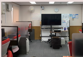
キャリアカウンセラーに必要な ITスキルも一緒に学習